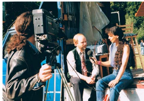
►► Aktion „von – zu +“, Augsburg, Wittelsbacher Park