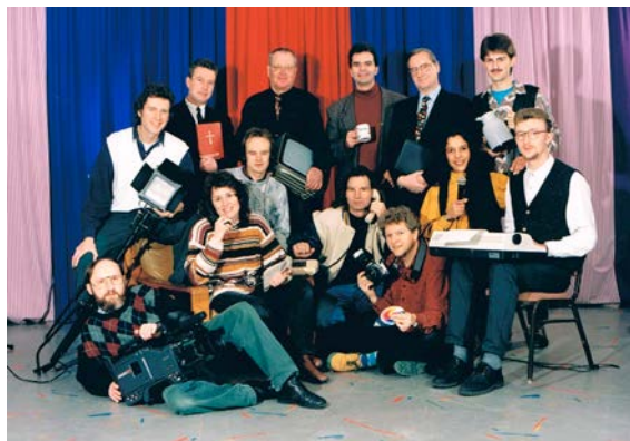
► Das erste Redaktionsteam